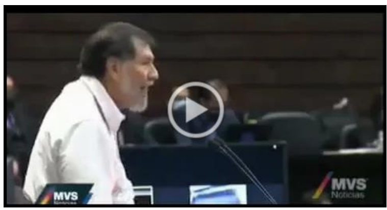
Confrontaciones e insultos en San Lázaro por la falta de medicamentos oncológicos y aniversario luctuoso de Ernesto ‘Che’ Guevara.mp4 - Google Drive

El día de ayer fue de confrontación e incluso de insultos en la Cámara de Diputados, se trataron dos asuntos, desde la tribuna de San Lázaro los legisladores del PAN subieron a presentar un punto de acuerdo en materia de quimioterapias, la falta de medicamentos para los pacientes con cáncer en el país y también se trató de manera inédita una efeméride con el tema del aniversario luctuoso de Ernesto ‘Che’ Guevara. Estos dos temas fueron el motivo de discordia, de insultos, de reparto de culpas y de algunos otros incidentes. En el caso de los panistas y los medicamentos para personas con cáncer, se subieron a la tribuna a pedir 5 mil millones de pesos en el Presupuesto 2022 para atender a estos pacientes, este asunto también generó polémica en el recinto parlamentario.