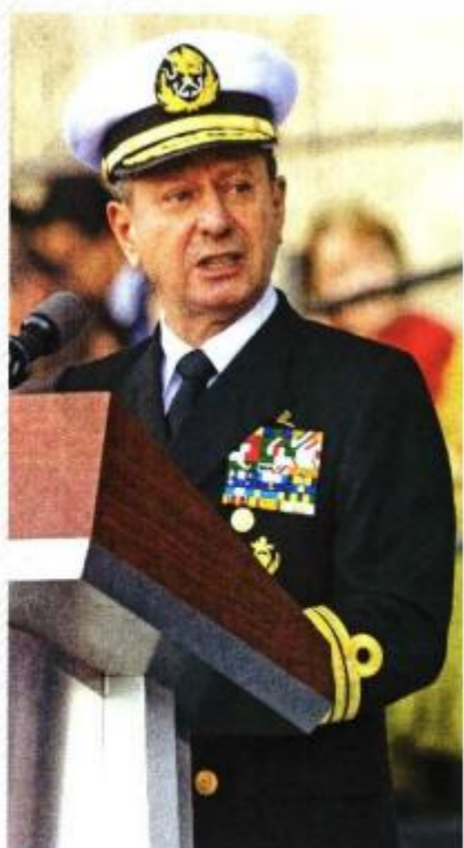
LUIS CRESENCIO SANDOVAL Secretario de la Defensa Nacional

"Reafirmamos que nuestro proceder es y será siempre apegado al marco jurídico vigente, sin aspiraciones ni pretensiones"