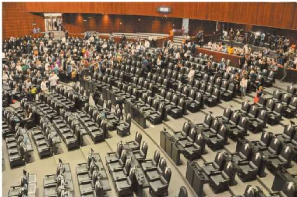
El salón de plenos de la Cámara de Diputados lució semivacío ayer, por la ausencia de los legisladores de oposición, al votarse las reformas a la Ley Minera.