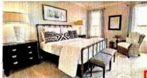
■ Tiene una recámara en primer piso y tres en el segundo piso.