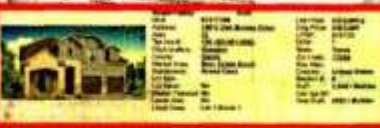
■ La propiedad tenía en 2020 un precio de lista de 334 mil dólares.