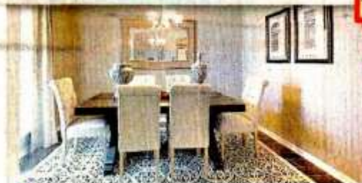
■ Los interiores pueden verse en la página de Redfin, con los muebles del propietario anterior.