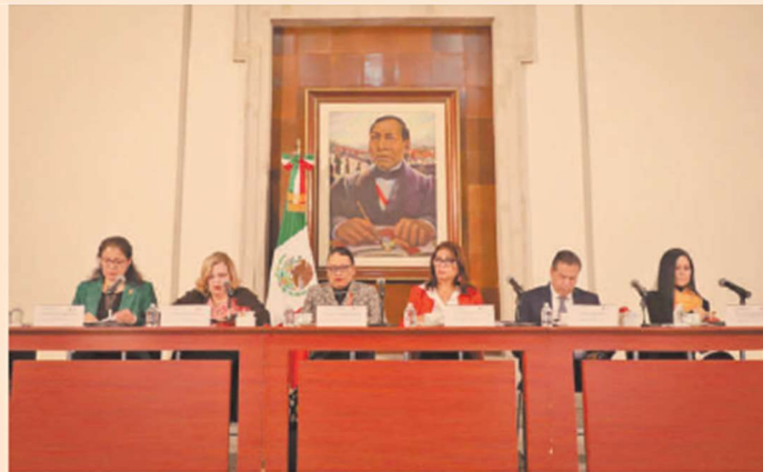
Funcionarias federales y estatales presentaron ayer los datos sobre violencia contra mujeres en el país.

Durante junio pasado, 89 mujeres fueron víctimas de feminicidio; 5% más que un mes anterior. Asimismo, durante el primer semestre de 2022 se registraron un total de 493 casos a lo largo de todo el territorio nacional.