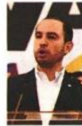
AGENCIAS DE INFERENCIA

Los dirigentes nacionales y coordinadores parlamentarios de Va por México aclararon que no aprobarán ninguna reforma constitucional que debilite al INE, a los tribunales electorales o militarice al país.