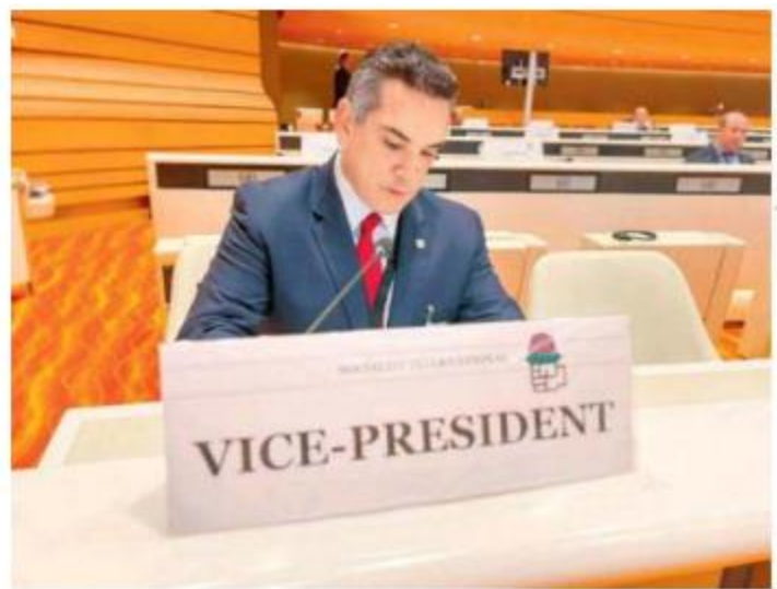
Ayer lo nombraron vicepresidente de la Internacional Socialista