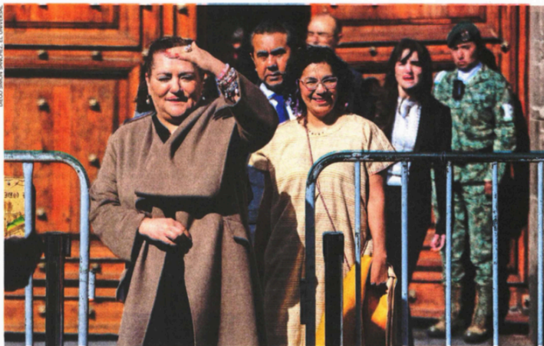
La titular del INE, Guadalupe Taddel, la secretaria ejecutiva del instituto y los consejeros acudieron a un encuentro con la Presidenta.