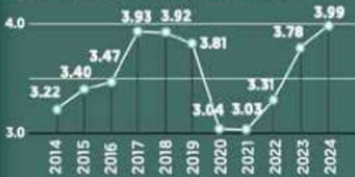
■ Producción de millones de autos al año

Durante 2024, la producción de automóviles alcanzó su mejor nivel con casi 4 millones de unidades.