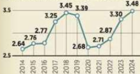
■ Exportación de millones de autos al año

Durante el año pasado, se exportaron 3.48 millones de autos, el mejor registro desde 2018.