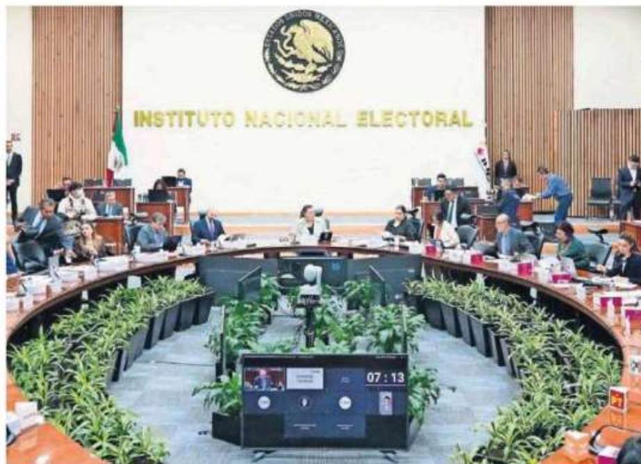
El Consejo General del INE aprobó un presupuesto precautorio para realizar el proceso electoral extraordinario el próximo año cuando se elegirán 881 cargos de jueces, magistrados y ministros.

En tanto, el tema de salarios inquieta porque se ha acompañado de otros costos laborales como aumento de días de vacaciones sin que haya mejoría en la productividad, lo que genera inflación, junto al aumento de precios en productos agropecuarios, dijo. ●