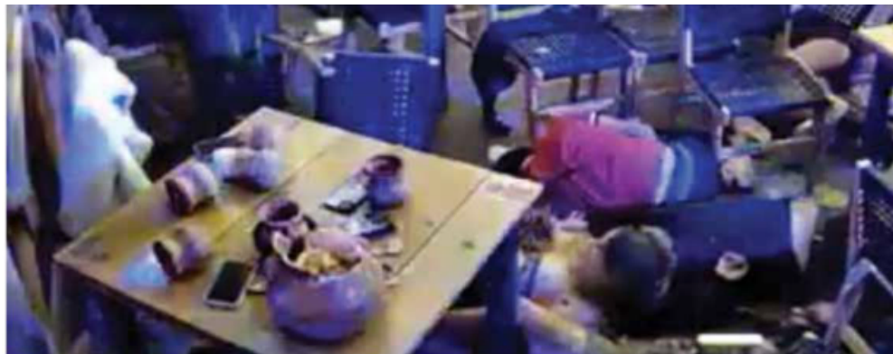
● CENTRO. Los Cantaritos están en el primer cuadro de la ciudad de Querétaro.

Otro de las masacres registradas fue en Jesús María el pasado 9 de octubre, donde