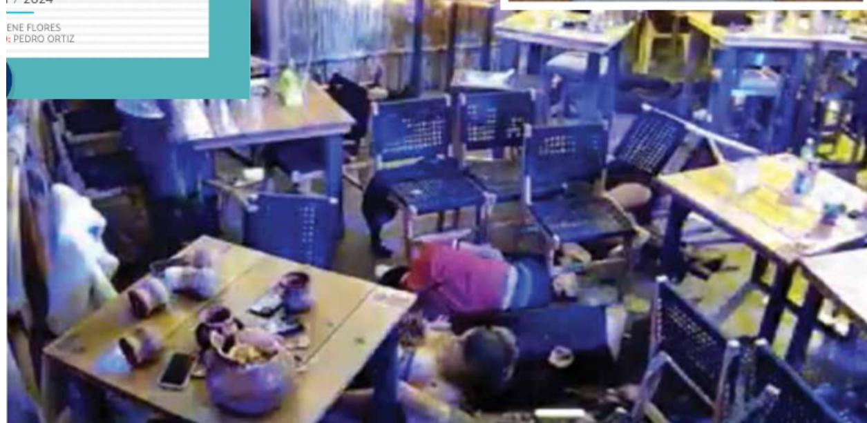
● CENTRO. Los Cantaritos están en el primer cuadro de la ciudad de Querétaro.