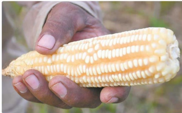
Maíz transgénico.

El presidente de la Comisión de Punto Constitucionales, Leonel Godoy , informó que la iniciativa para reformar la Constitución, de la presidenta Claudia Sheinbaum , será modificada en la Cámara de Diputados .