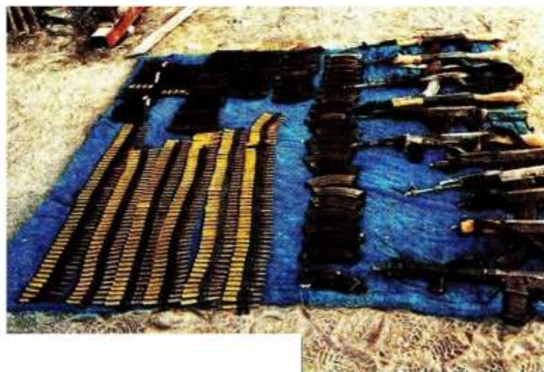
Incautaciones por parte de autoridades federales en Michoacán y Sinaloa. ESPECIAL