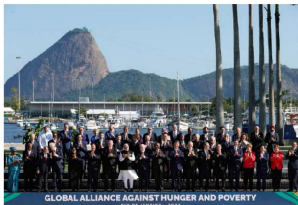
La foto oficial, en el arranque de los trabajos, de los jefes de Estado de las 20 mayores economías del mundo