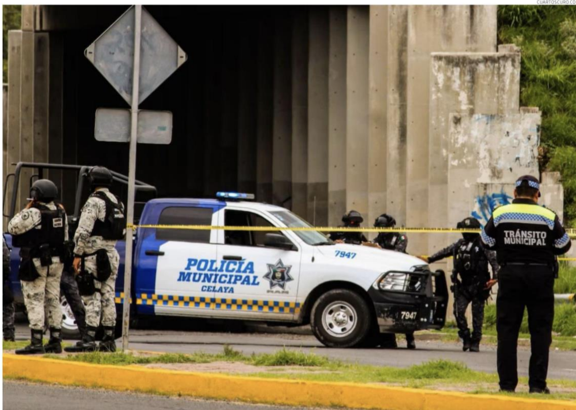
Guanajuato encabeza la lista con más policías asesinados en el país.

Condiciones precarias, acuartelamientos y falta del equipo necesario para cumplir con sus labores y abandono de las autoridades, entre las principales causas, revela informe de Causa en Común