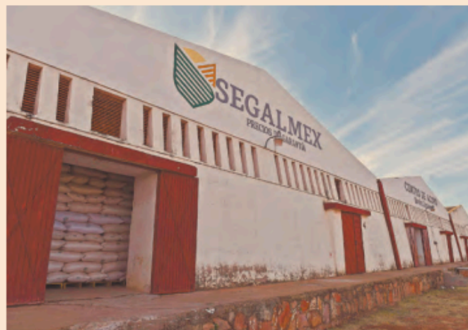
La Auditoría Superior de la Federación detalló en casi un centenar de páginas las anomalías en Segalmex.

“Por lo anterior queda pendiente de comprobar, aclarar,