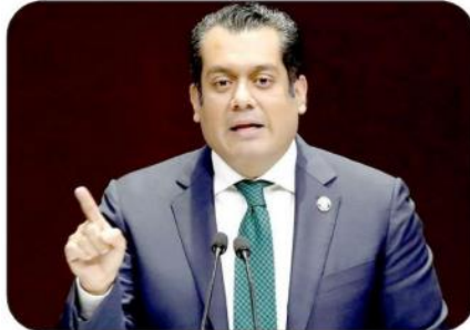
Sergio Gutiérrez Luna