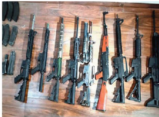
Armamento decomisado a la organización sinaloense. ESPECIAL