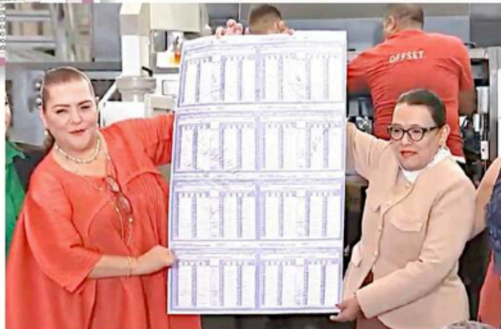
■ El viernes inició la impresión de boletas para la elección.