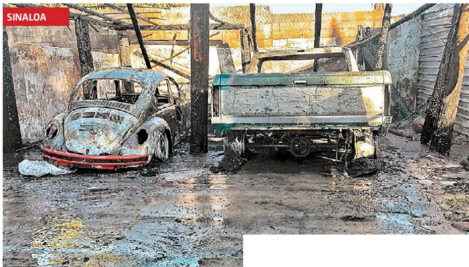
Sujetos incendian autos; en Zacatecas, hallan el cuerpo de un hombre en Michoacán acordonan zona. ESPECIAL Y CUARTOS CURO

• FUENTE: Gabinete de Seguridad • GRÁFICO: Juan Carlos Fleicer