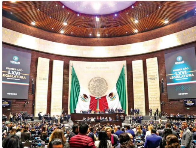
El segundo periodo de sesiones en la Cámara de Diputados inició con fuertes desacuerdos.

El Pleno de la Cámara de Diputados aprobó en lo general y en lo particular (con 322 votos a favor, 107 en contra y cero abstenciones) la reforma a la Ley del Instituto del Fondo Nacional de la Vivienda para los Trabajadores (Infonavit) y a la Ley Federal del Trabajo, en materia de vivienda con orientación social.