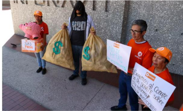
Activistas se manifiestan para sustritar su reclamo a la Ley Infonavit, en Ciudad de México, el 30 de enero.

El día ha llegado para definir el rumbo del Instituto del Fondo Nacional de la Vivienda para los Trabajadores (Infonavit). Este 1 de febrero, el primer día del periodo legislativo en la Cámara de Diputados, los legisladores aprobaron la reforma a la ley del instituto, un proyecto que ya fue discutido y modificado en la Cámara de Senadores y que solo espera su último visto bueno para entrar en vigor.