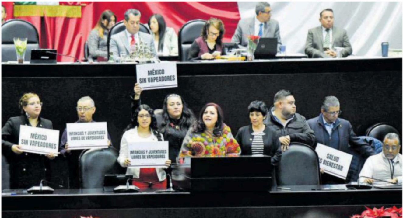
Diputados de Morena avalaron quitar el uso del vapeador.