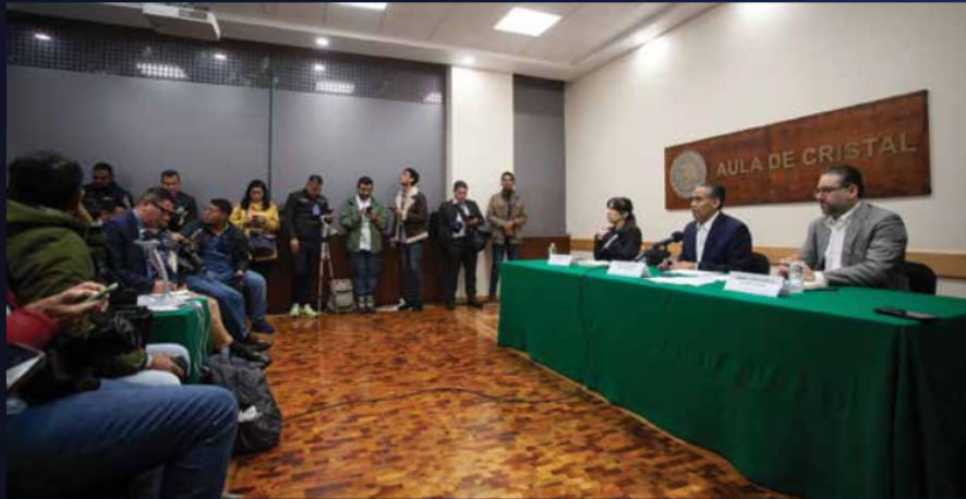
A través de su llamada “contra mañanera”, jueces rechazaron que el Senado haya elegido a los candidatos.

“Las listas que se hicieron públicas no estaban del todo depuradas. Mientras el comité