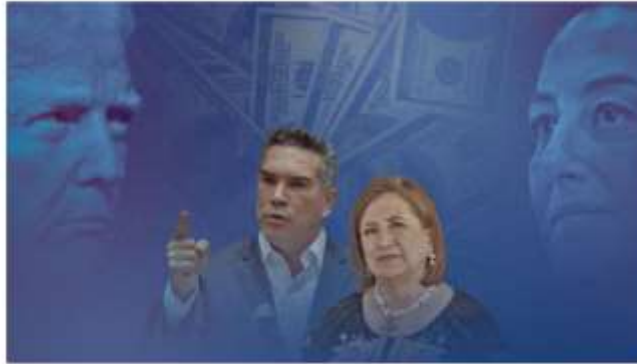
Políticos de la oposición celebraron el diálogo entre el gobierno de Sheinbaum y de Trump.

La negociación entre la presidenta Claudia Sheinbaum Pardo y su homólogo de Estados Unidos, Donald Trump, para suspender el pago de aranceles por un mes fue celebrado por legisladores, funcionarios y gobernadores de Morena, aunque los políticos de oposición también se posicionaron sobre el tema.