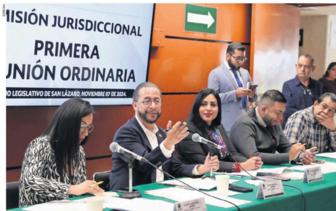
Los integrantes de la Comisión Jurisdiccional de la Cámara de Diputados ayer durante su reunión en San Lázaro.