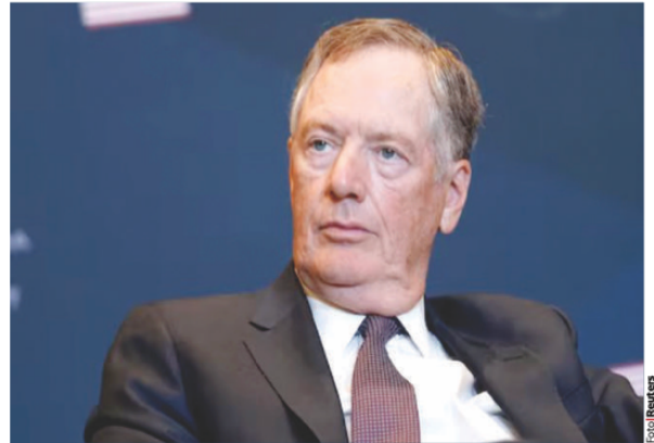
ROBERT Lighthizer, exrepresentante Comercial de EU, en foto de archivo.

La agencia citó fuentes "familiarizadas" con el asunto para asegurar que no es verdad que Trump le haya pedido a Bob que se incorpore a su equipo.