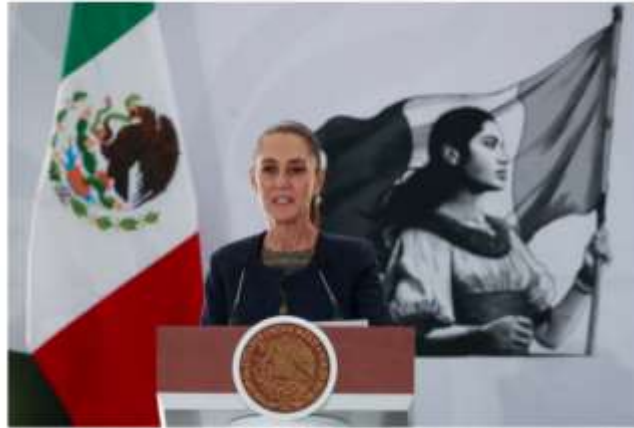
Mexico President Claudia Sheinbaum speaks during an event marking the 57th anniversary of state oil company PEMEX, founded after the expropriation of foreign oil firms, in Mexico City, Mexico, March 18, 2025.

Claudia Sheinbaum Pardo, titular del Ejecutivo en México, esclareció los detalles tras sostener una reunión con representantes de la Coordinadora Nacional de Trabajadores de la Educación (CNTE) para la derogación de la reforma a la Ley del ISSSTE; la cual mantuvo ciertas inconformidades y confusiones tras su anuncio el 7 de febrero del 2025.