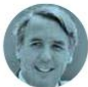
EMILIO AZCÁRRAGA JEAN

► Se puso alta la vara el secretario de Educación, Mario Delgado , en sus propósitos para 2026. Anunció que se construirán 20 nuevos planteles de bachillerato, los cuales se sumarían a las dos decenas que se prometieron para 2025, de los cuales dos están terminados, 12 se entregarían este mes y los otros seis en enero próximo.