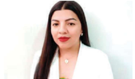
LA NUEVA funcionaria, designada el domingo pasado.