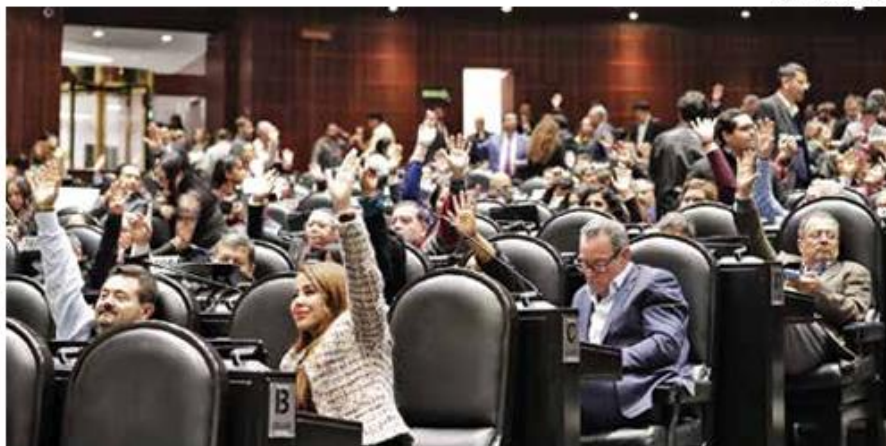
• PLENO. Legisladores de Morena emitieron su voto en favor de la reforma.