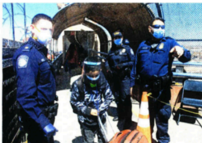
De enero a noviembre de 2025 se redujo la cifra de deportaciones de menores en 75.38%, según datos del INM.

De acuerdo con la información del INM, encabezado por Sergio Salomón Céspedes, los trámites de las deportaciones se hacen bajo los pro-