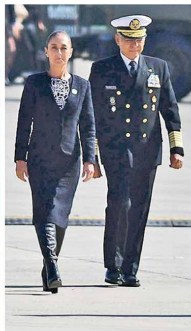
● LEALTAD. La presidenta Claudia Sheinbaum conmemoró el 111 aniversario de la Fuerza Aérea Mexicana y entregó 30 condecoraciones a pilotos.