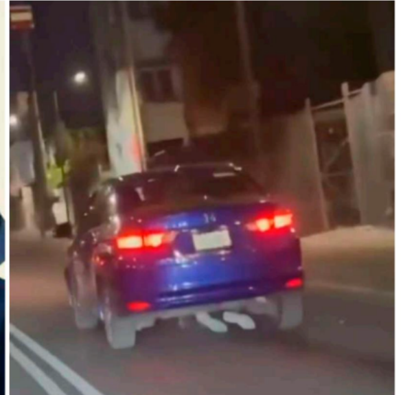
Gaby "N" fue trasladada al penal de Santa Martha Acatitla.