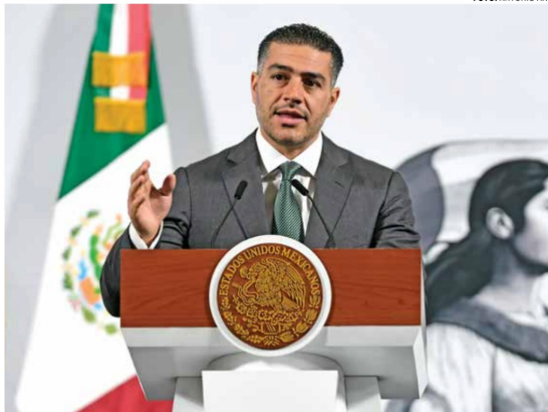
• MAÑANERA. El secretario García Harfuch estuvo ayer en Palacio Nacional, con la Presidenta.