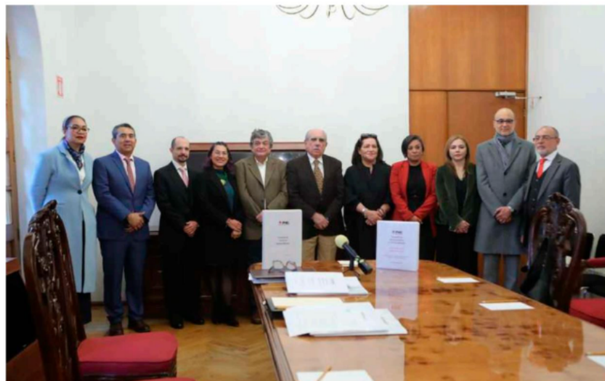
Las propuestas derivan de la experiencia acumulada en el Proceso Electoral Federal Concurrente 2023-2024.

Finalmente indicó a Pablo Gómez que todos en el Instituto Nacional Electoral están dispuestos a contribuir para que la reforma logre el éxito deseado.