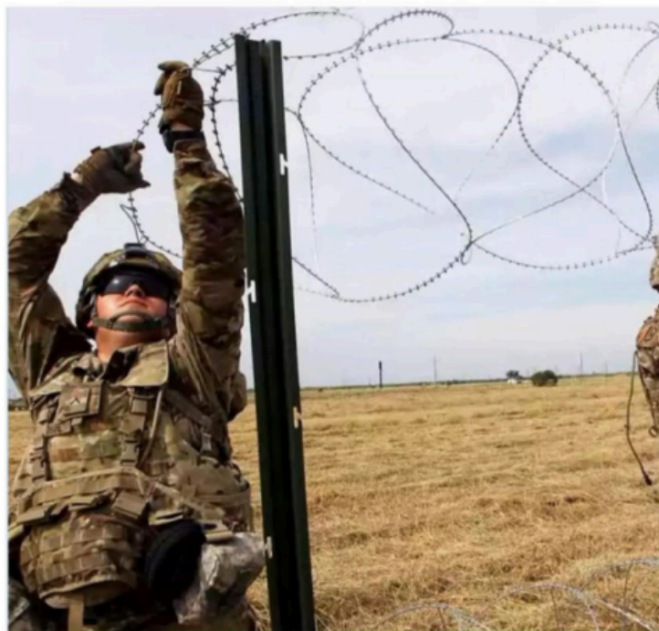
En los próximos 45 días deberá comenzar el despliegue de más elementos.

A través de una orden presidencial emitida el viernes, el mandatario republicano ordenó a los secretarios de Defensa, Seguridad Nacional, Interior y Agricultura facilitar el traspaso de los terrenos públicos en la frontera común con México, para permitir "actividades militares" en instalaciones que pasan a la jurisdicción del Pentágono.