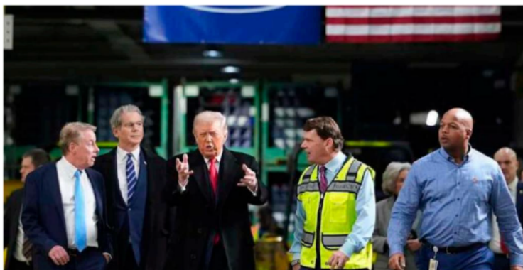
Será en el curso de este año cuando se zanje finalmente la cuestión del T-MEC

En adición, Trump argumentó que mientras su vecino del norte sí depende de los vehículos producidos en los Estados Unidos, la unión americana no necesita autos hechos en Canadá o en México; “El problema es que no necesitamos su producto. No necesitamos coches