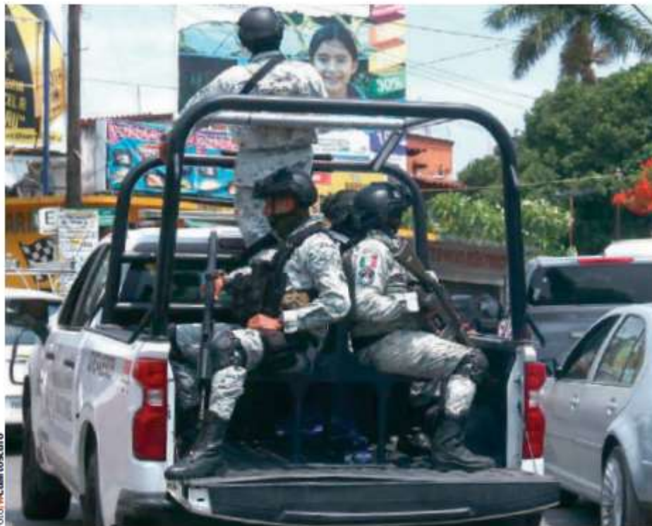
ELEMENTOS de la Guardia Nacional patrullan cerca de donde fueron asesinados tres policías municipales de Huimanguillo, el domingo.