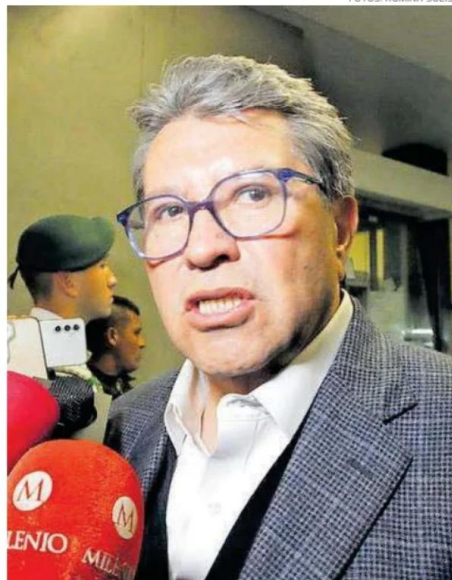
Ricardo Monreal dijo que hablaron del gasto electoral