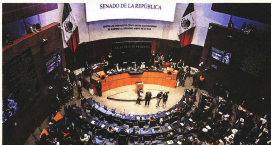
De acuerdo con el Congreso mexicano, del 1 de diciembre de 2018 al 30 de septiembre de 2024 se llevaron a cabo 41 reformas.

El 50% de las reformas fueron presentadas por el Ejecutivo; el restante fue a propuesta de Morena en el Congreso.