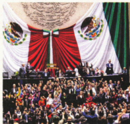
Sesión en la Cámara de Diputados en la que se discutieron las reservas a la Ley de Aguas.