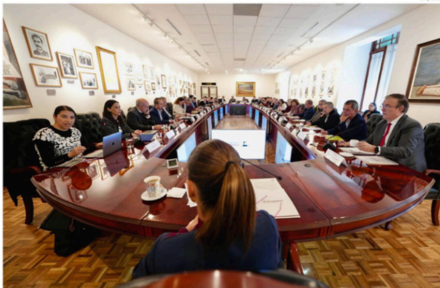
La presidenta Claudia Sheinbaum durante su reunión con economistas en Palacio Nacional.

Destacó la importancia de mantener un diálogo técnico en momentos clave para la relación económica regional, previo a la revisión del T-MEC