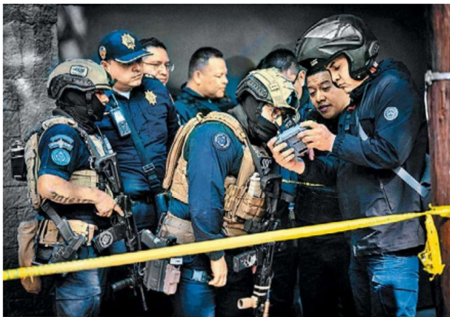
Despliegue policiaco en la calle Río Ebro; a la derecha, agentes observan imágenes de un dron cerca del lugar donde su compañero fue lesionado.