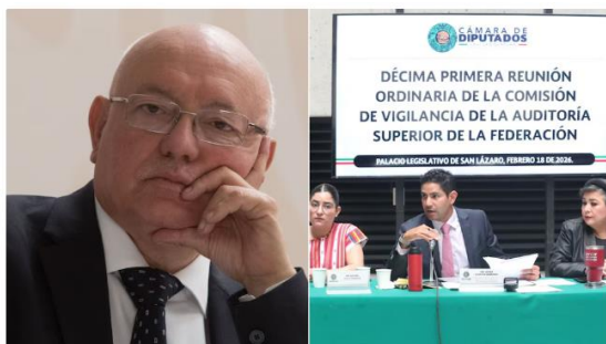
David Colmenares será sustituido en la ASF en el mes de marzo.

Este 19 de febrero de 2026 arrancó la recepción de solicitudes y documentación para quienes aspiran a encabezar la Auditoría Superior de la Federación (ASF) durante el periodo 2026-2034 . Bajo la supervisión de la Comisión de Vigilancia en la Cámara de Diputados , que preside el diputado Javier Octavio Herrera Borunda, comenzó un proceso que definirá el rumbo de la fiscalización federal en México.