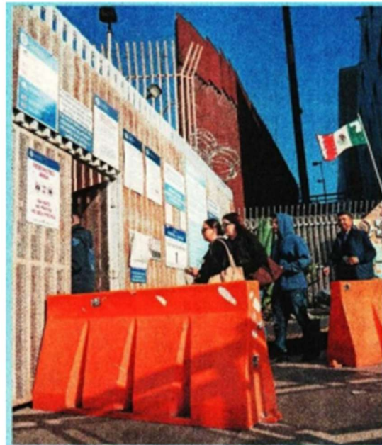
Paisanos han denunciado las extorsiones tanto por vía terrestre como aérea al llegar a México.

pública contra los agentes y quienes resulten responsables. ●