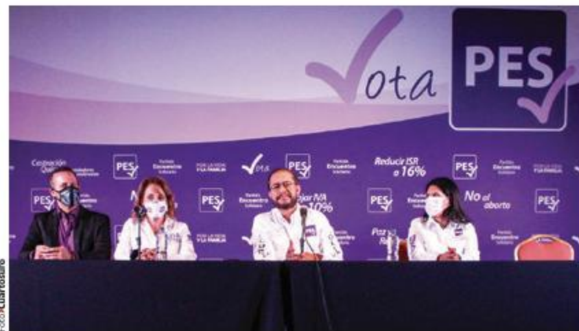
CONFERENCIA de prensa del cierre nacional del PES, el 2 de junio del 2021.