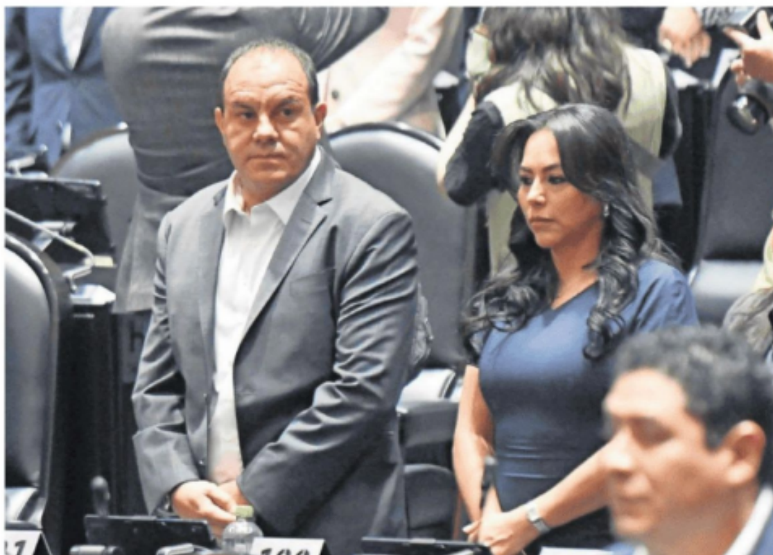
El diputado Cuauhtémoc Blanco es señalado por presunto abuso sexual en grado de tentativa.