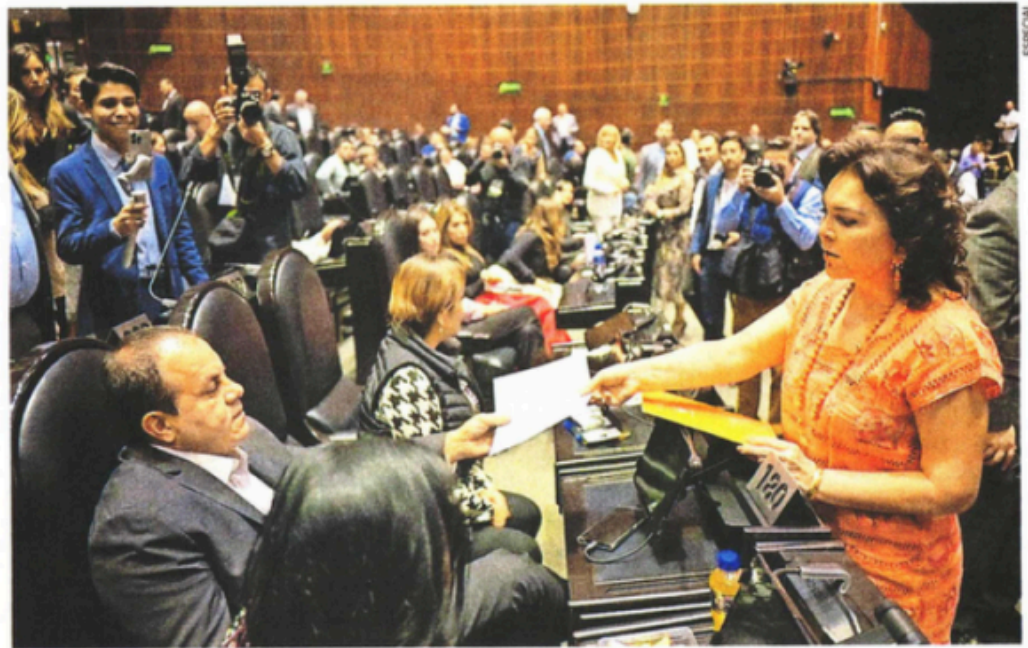
La diputada naranja Ivonne Ortega enfrentó al que dijo fue su ídolo, el diputado Cuauhtémoc Blanco, de Morena, a quien le entregó una misiva y le pidió ser congruente y solicitar licencia para que lo investiguen por abuso sexual.

“Vine a saludarte, estuve reflexionando muchísimo con respecto de lo que ha estado pasando y dije que la única manera de que se pueda lograr justicia, para ti o para la víctima, es que seas tú el que pida licencia, se separe del cargo y pueda comparecer. Quiero compartirte que eras mi ídolo en el América, pensé mucho en entregar la carta y lo hago como una seguidora tuya que hoy desconfía de