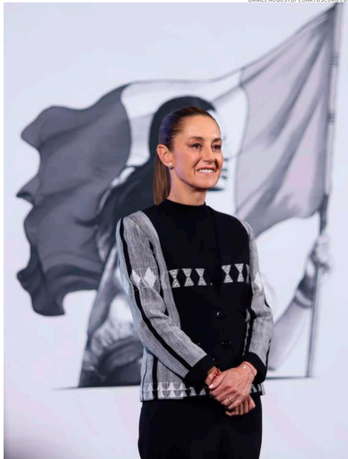
La presidenta Claudia Sheinbaum, en la conferencia "La Mañanera del pueblo" en Palacio Nacional.

En este sentido, es importante mencionar que prácticamente al inicio del segundo mandato presidencial de Donald Trump, amenazó con imponer a México y Canadá 25% de aranceles a las mercancías que