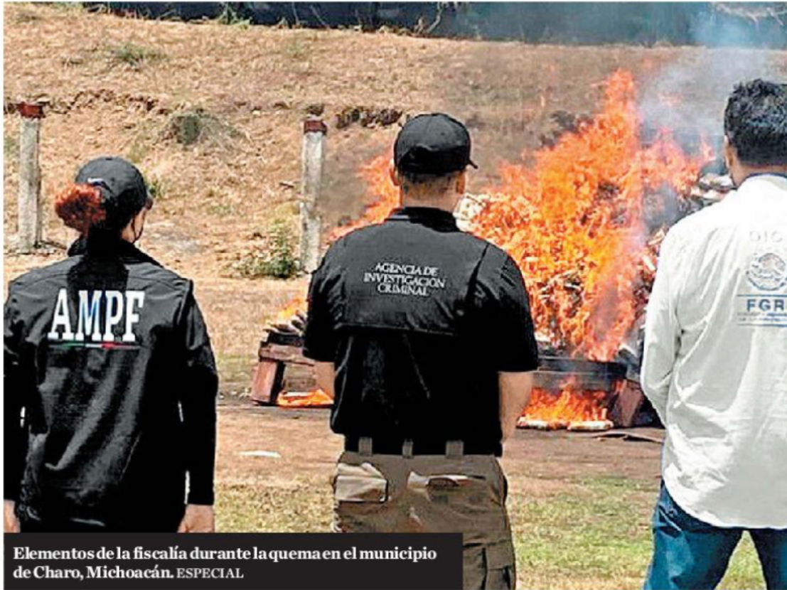
Elementos de la fiscalía durante la quema en el municipio de Charo, Michoacán.